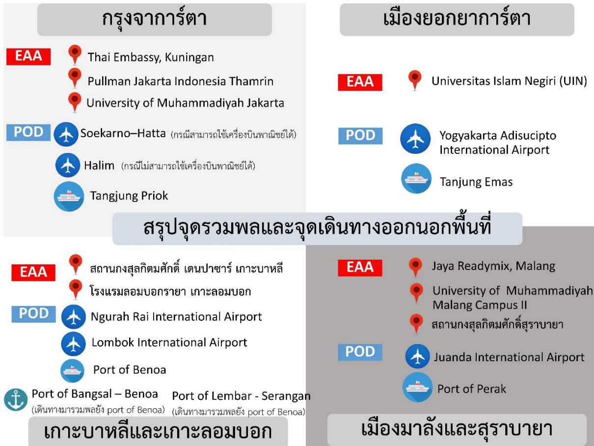
รูปภาพที่ 7 สรุปจุดรวมพล และจุดเดินทางออกนอกพื้นที่ในการอพยพคนไทย