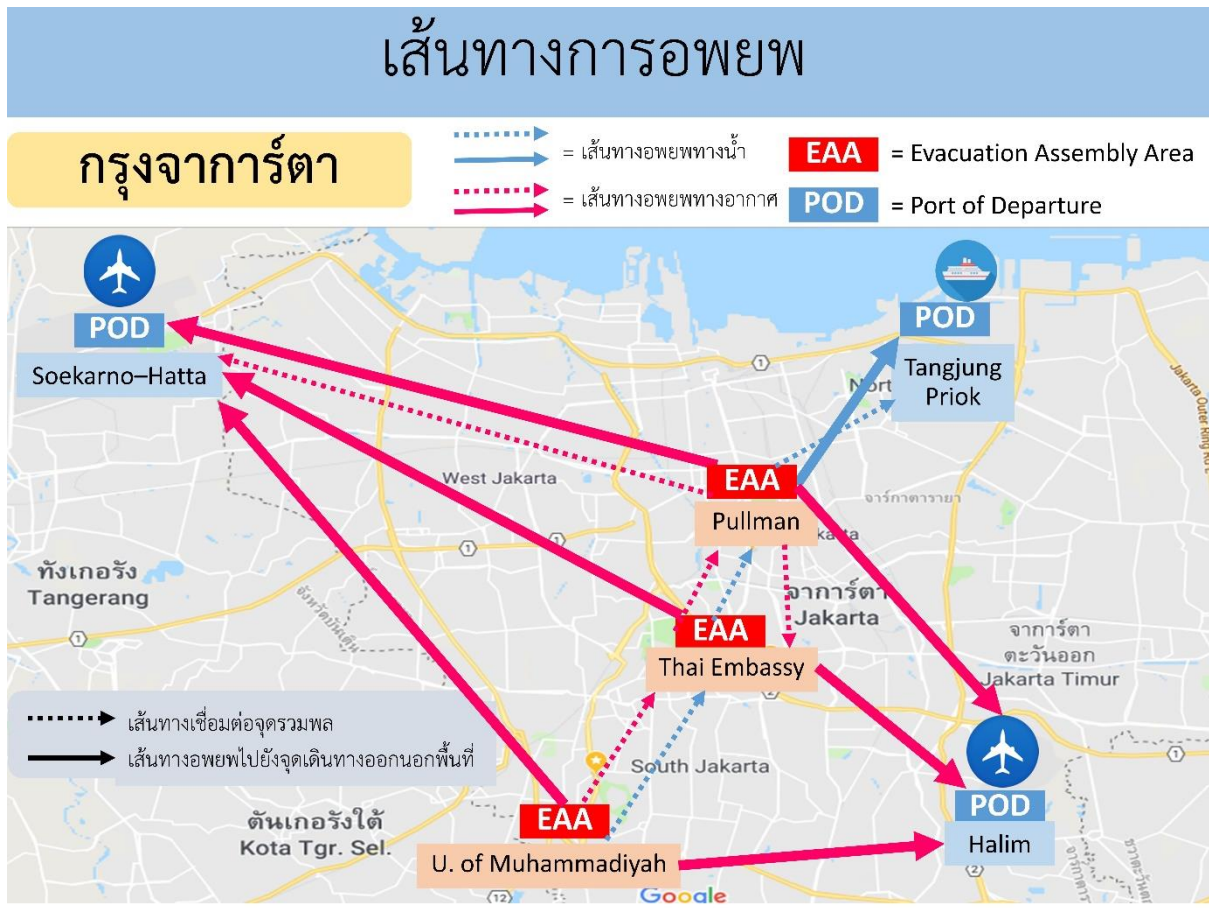
รูปภาพที่ 3 แสดงเส้นทางอพยพในกรุงจาการ์ตาจากจุดรวมพลไปยังจุดเดินทางออกนอกพื้นที่