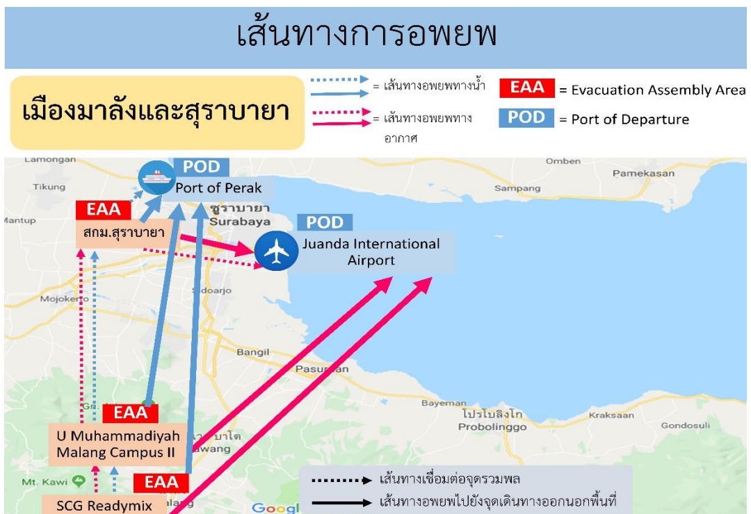
รูปภาพที่ 6 แสดงเส้นทางการอพยพเมืองมาลังและสุรabayaจากจุดรวมพลไปยังจุดเดินทางออกนอกพื้นที่