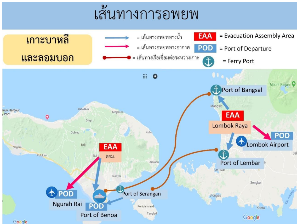
รูปภาพที่ 5 แสดงเส้นทางการอพยพเมืองเดนปาซาร์จากจุดรวมพลไปยังจุดเดินทางออกนอกพื้นที่