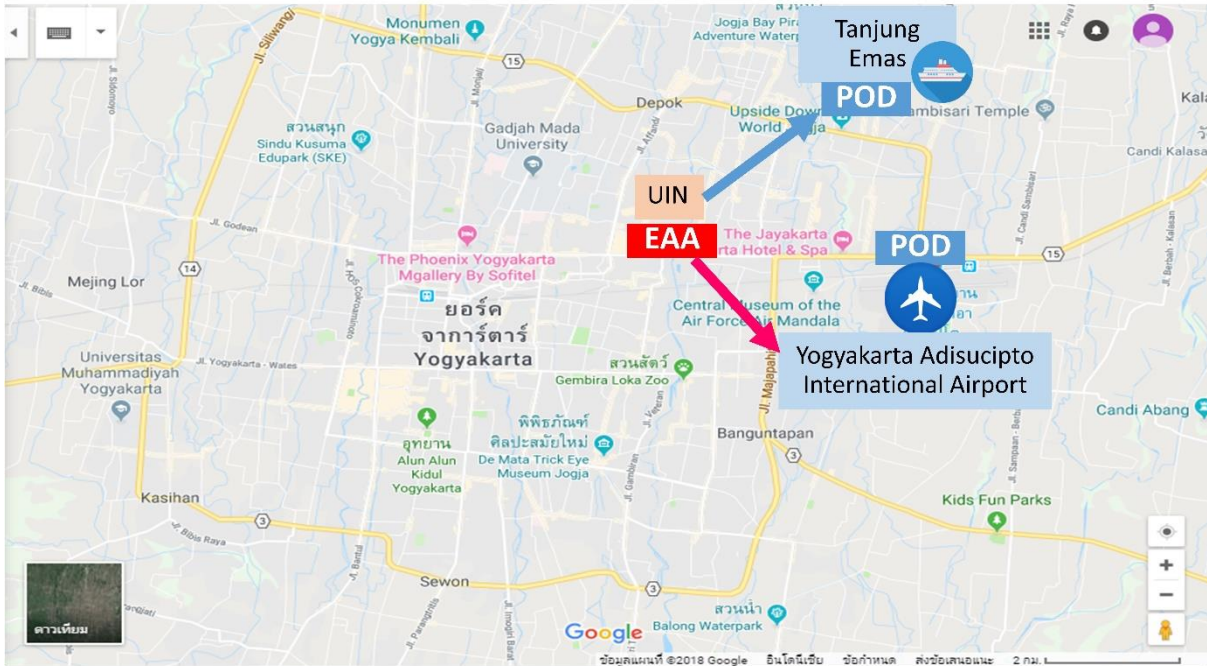
รูปภาพที่ 4 แสดงเส้นทางอพยพในเมืองยogyakarta จากจุดรวมพลไปยังจุดเดินทางออกนอกพื้นที่