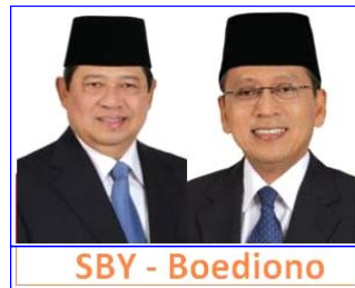
SBY - Boediono